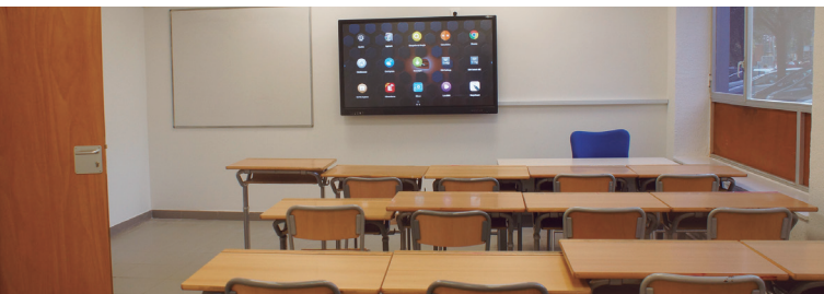
IKASGELAK / AULAS